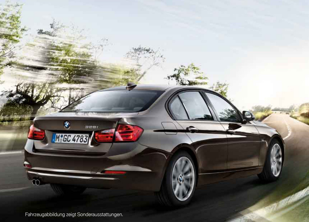
Fahrzeugabbildung zeigt Sonderausstattungen.